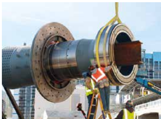
◀ One of the 2 bearings on the High Roller Ferris wheel installed in Las Vegas, and axle assembly on site.