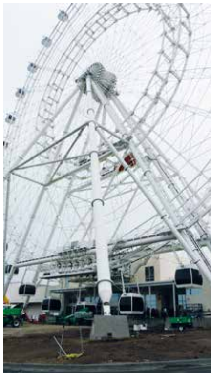
↑ The masts on the Orlando Eye Ferris wheel.