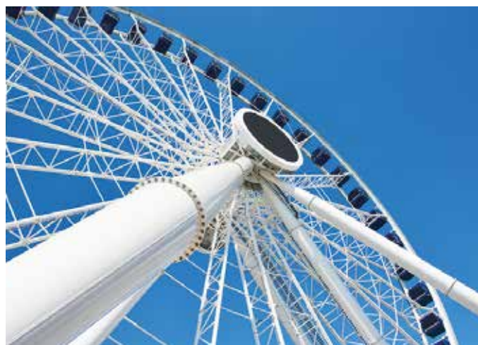
◀ The Hong Kong Observation Wheel and a close-up of some bolted joints.